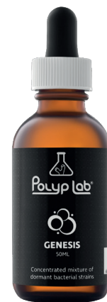
Miscela concentrata di batteri dormienti