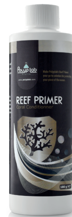
Condizionatore per coralli