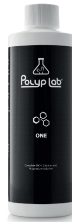
Integratore di CA-MG-CKH