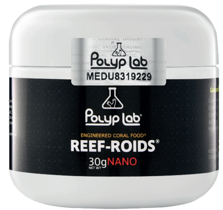
Cibo per coralli