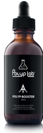
Booster per coralli